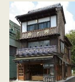
E13 大和屋本店 (乾物屋)