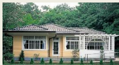
W7 田園調布の家 (大川邸)