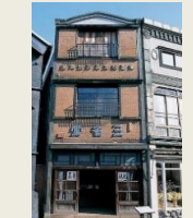
E6 武居三省堂 (文具店)