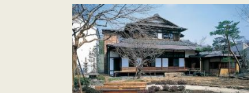
W2 三井八郎右衛門邸