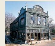
E10 丸二商店 (荒物屋)