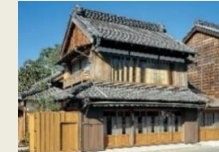
E12 川野商店 (和傘問屋)