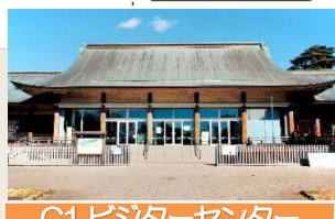
C1 ビンターセンター (旧光華殿)